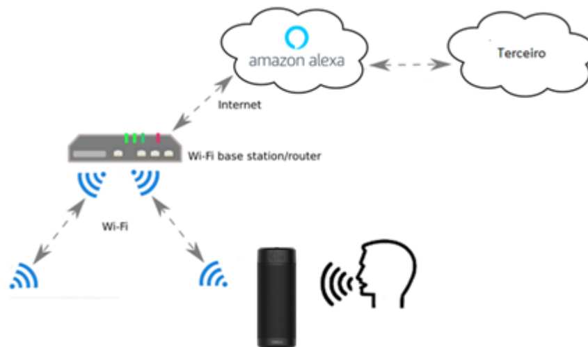
Figura 1 – Sistema