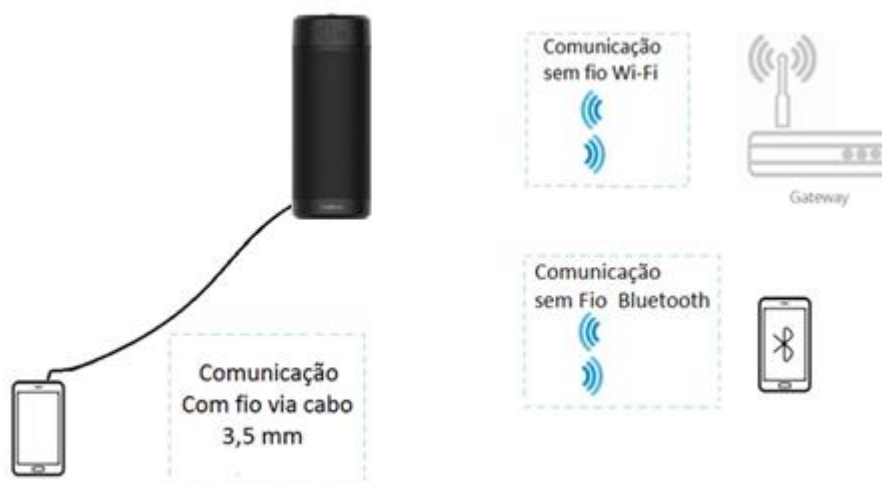
Figura 2 – Cenários de uso