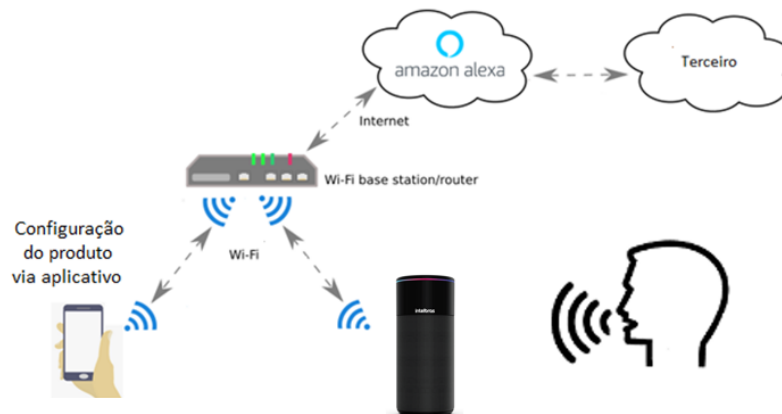
Figura 1 – Sistema