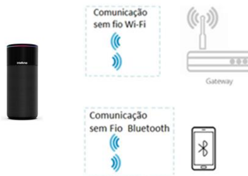
Figura 2 – Cenários de uso