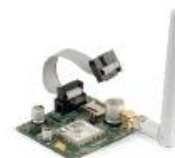
XAG 8000 Módulo GPRS