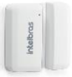
XAS 8000 Sensor de abertura magnético sem fio