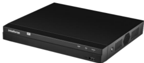
Gravador Digital de Vídeo NVD 1408