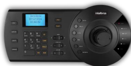
Mesa Controladora Híbrida (Análogica e IP) VTN 2000