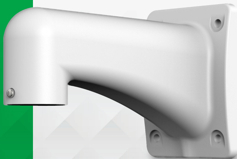
Suporte de parede para speed dome