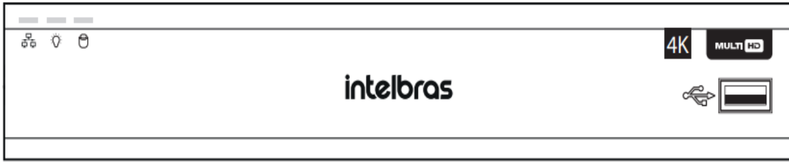
Foto do produto