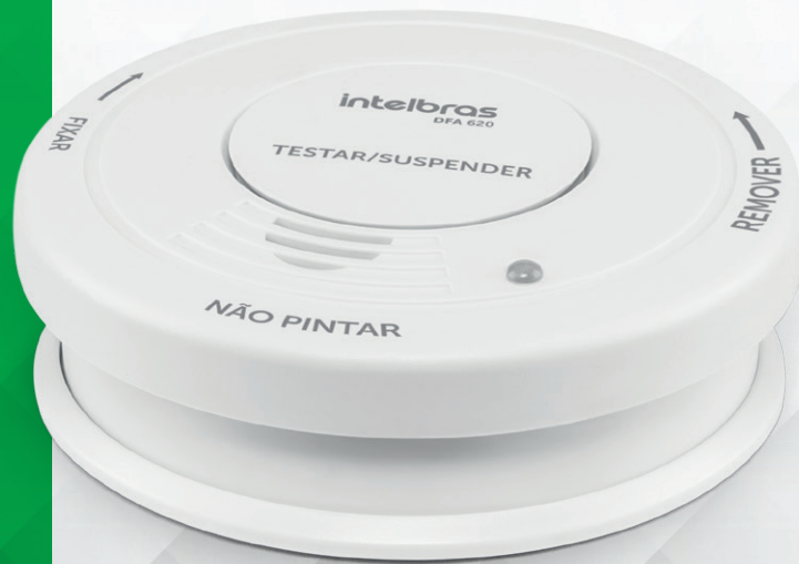
Detector de Fumaça Autônomo