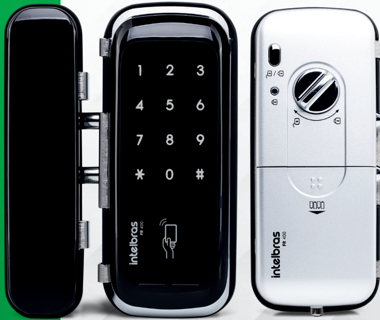
Fechadura digital de sobrepor para portas de vidro