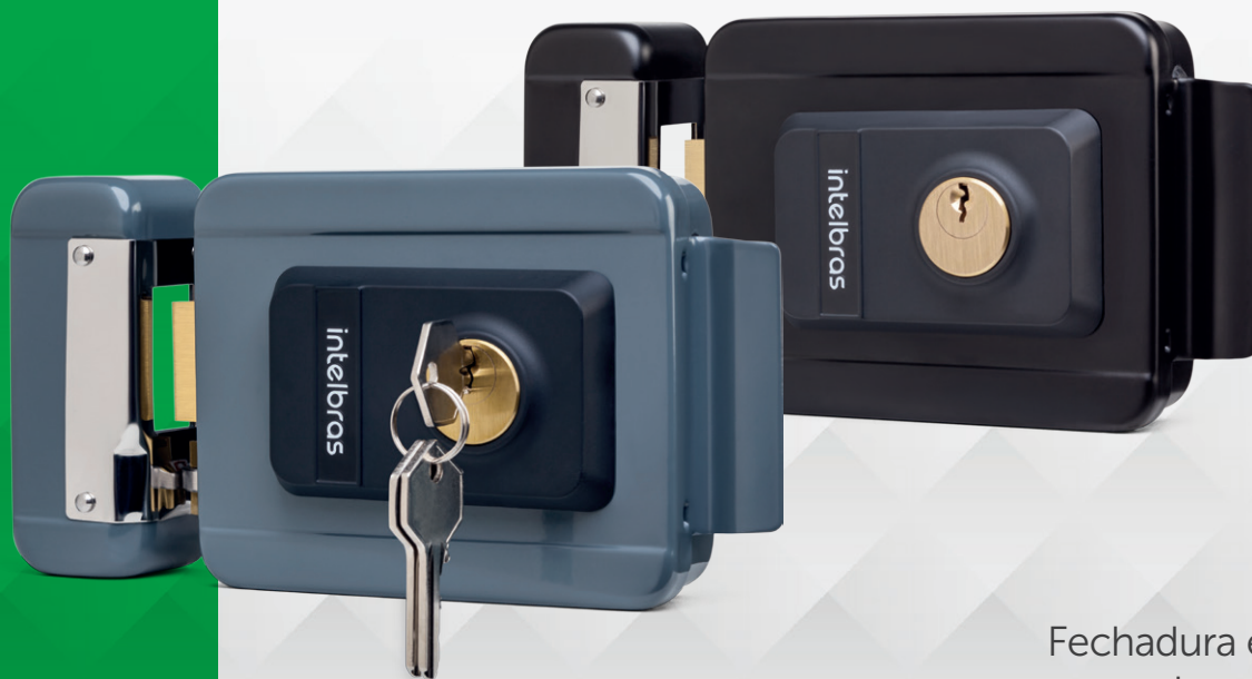
Fechadura elétrica de sobrepor