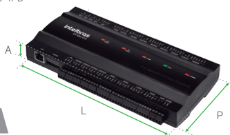
CT 500 4PB