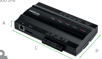
CT 500 1PB

CAPACIDADE DE ARMAZENAR ATÉ 100 MIL EVENTOS