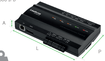
CT 500 1PB

CAPACIDADE DE ARMAZENAR ATÉ 100.000 EVENTOS