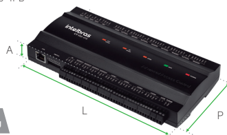
CT 500 4PB