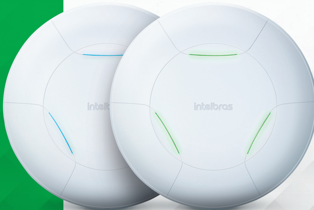
Access Point corporativo