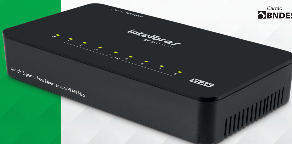
Switch Fast Ethernet