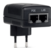
PoE 4805 PF Injetor PoE passivo Fast Ethernet