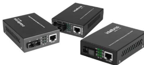
Conversores de mídia

Suporte a clientes: (48) 2106 0006 Fórum: forum.intelbras.com.br Suporte via chat: intelbras.com.br/suporte-tecnico Suporte via e-mail: suporte@intelbras.com.br