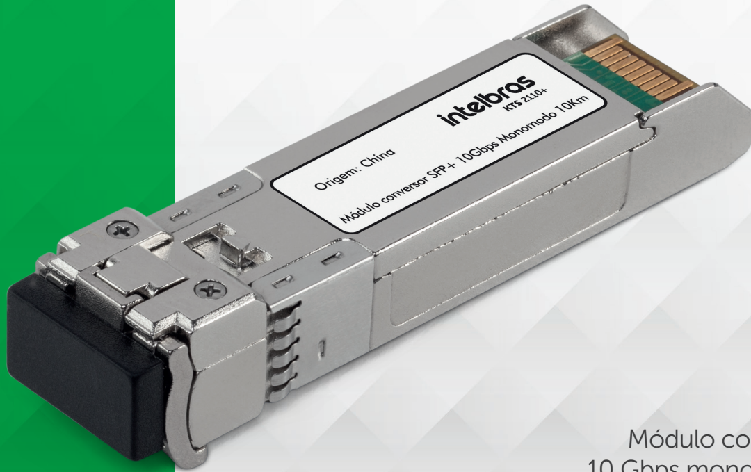
Módulo conversor SFP+ 10 Gbps monomodo 10 km