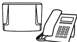
Central Telefônica e Telefone