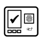
Controle de acesso