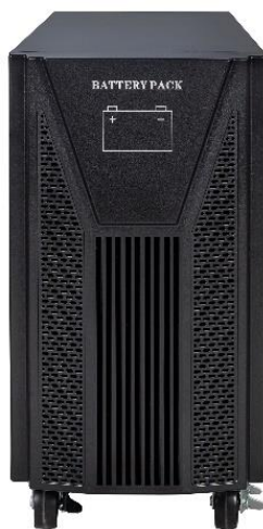
MB 1607 192V TW

Módulo de baterias externas 192 V (16 x 7 Ah)