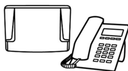
Central Telefônica e Telefone