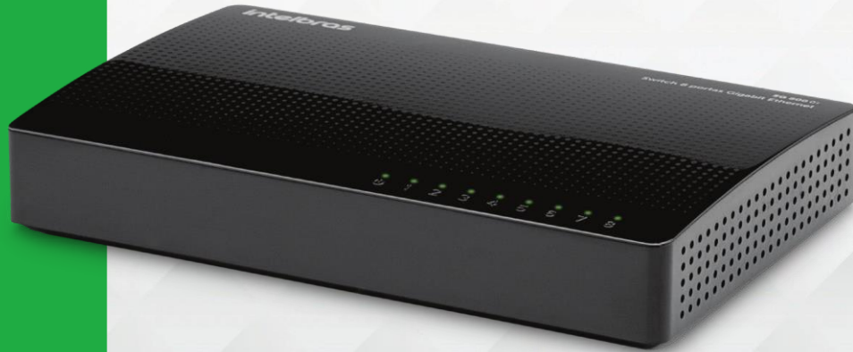
Switch 8 portas Gigabit Ethernet